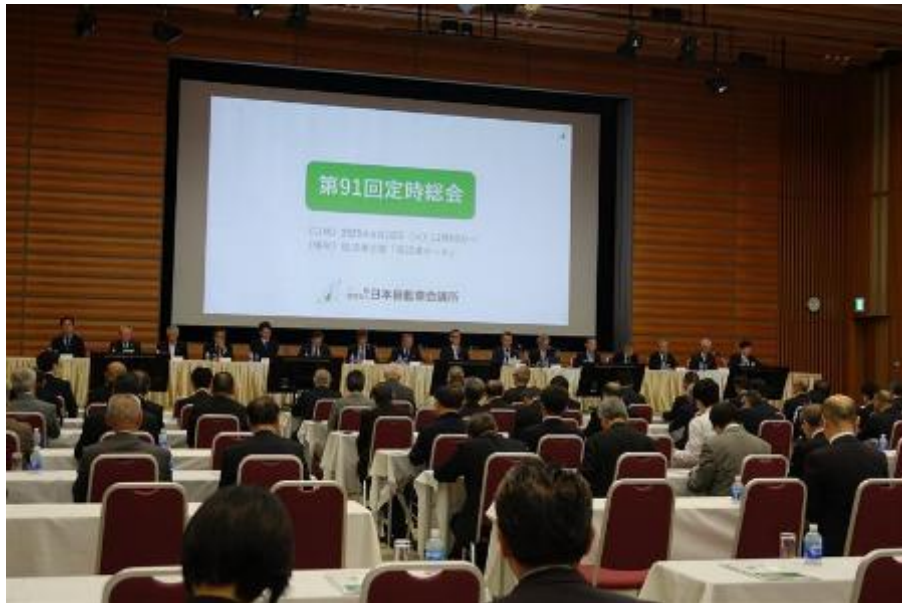
総会・理事会会場（経団連ホール）