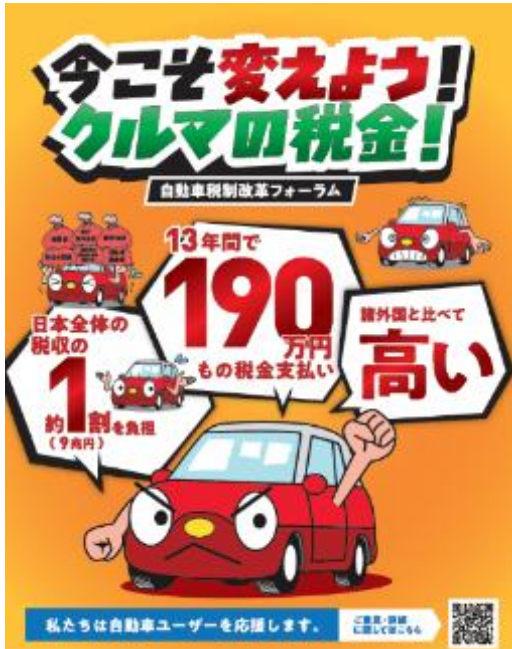
2025統一活動デザイン