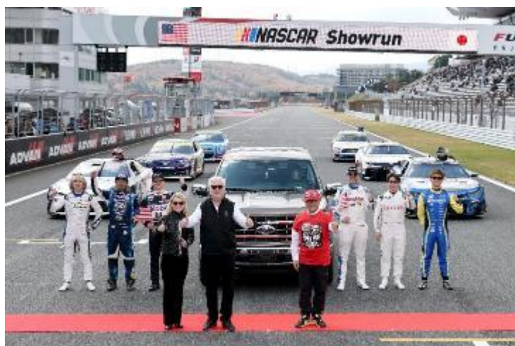
グラス駐日大使をお迎えしたセレモニー

さまざまな事情を抱えた子供たちを本企画に招待し、自動車産業やモータースポーツ業界へのあこがれを醸成