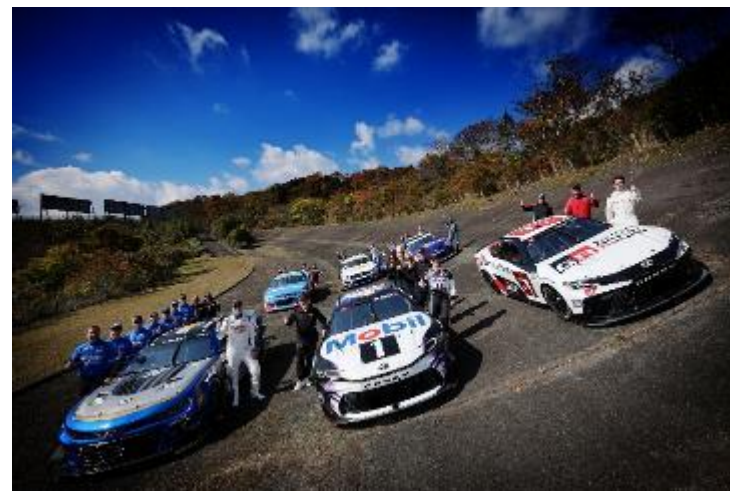
6台のデモカーと記念撮影

本事業で日本自動車会議所は、（一社）スーパー耐久未来機構などともに、「2025-2026 日本カー・オブ・ザ・イヤー実行委員会特別賞」を受賞