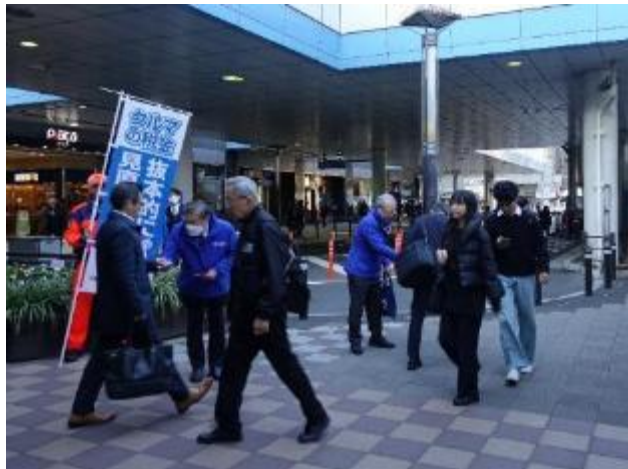
街頭活動の様子(11/14 東京・田町)