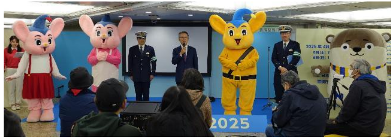
警視庁・NASVAのマスコットキャラクターとともにオープニングセレモニー

【開催日】 2025年4月5日(土)・6日(日) 【会場】 新宿駅西口広場イベントコーナー 【主催】 日本自動車会議所・警視庁新宿警察署 【後援】 内閣府、警察庁、国土交通省、東京都、警視庁交通部