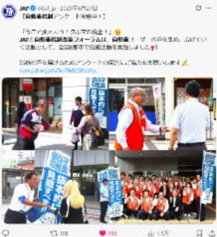
JAF・フォーラムSNS 発信