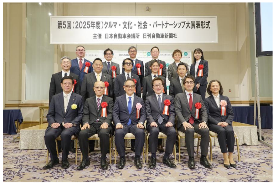
表彰式(3/16) 受賞者との記念写真