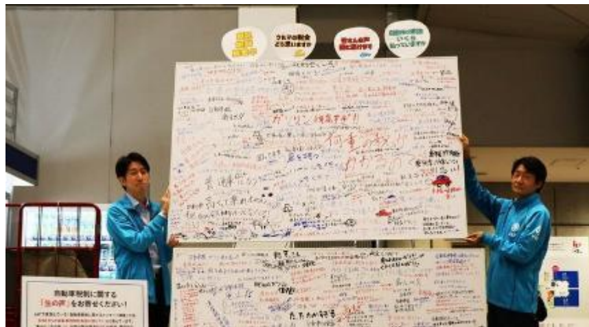
JMSで集まったユーザーの生の声の書き込み