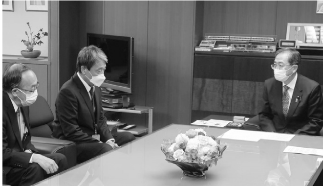
桑山代表（左から2人目）と横山副代表（左）から熱心にお話を聞かれる斉藤大臣（右）