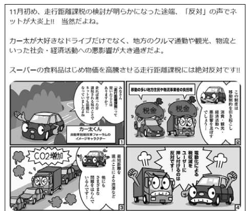
12月2日に投稿された「走行距離課税反対」のツイート