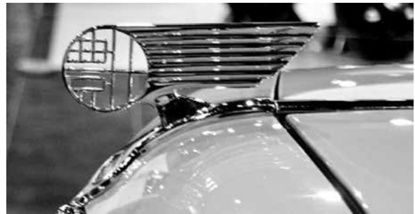
日本初の国産車「トヨタAA」(1936 トヨタ博物館所蔵車) 漢字のオーナメントに日本の誇りが感じられます。

また日常的な例では、「一富士二鷹三茄子」の初夢の縁起も見立てに連なる日本の美意識です。