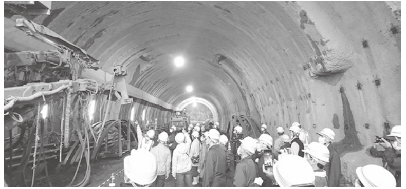
＜第2東名・羽根トンネル＞掘削直後に吹付コンクリート、ロックボルト等を使用し地山と一体化した支保構造を作る合理的なトンネル掘削工法を採用