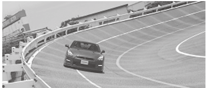
△日産グランドドライブ▽

【参加費】 1名=5,000円程度/日 (集合場所への乗車券やご宿泊の場合は個別負担で ご手配をお願いいたします) ※上記参加費には、食事代、バス代、高速道路料金 などが含まれます。 ※参加人数により、参加費は若干、変動いたします。