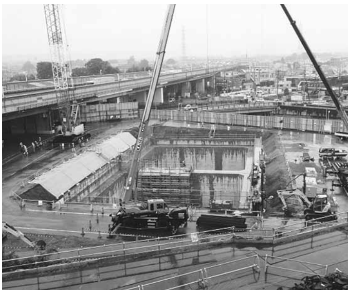
<外環・東名JCT>深さ69m 外環東名JCTに大深度トンネル立坑、シールド機掘削中